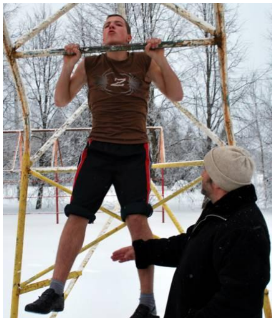
Edgarą teko net už kojos pristabdyti...