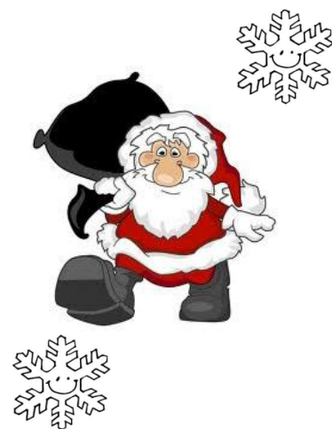
Įdomu, kas čia toks ateina?