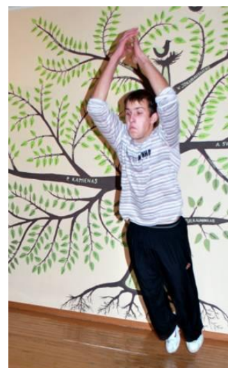
Šokant į tolį galima plasnoti, sklęsti arba tiesiog visu ilgumu griūti...