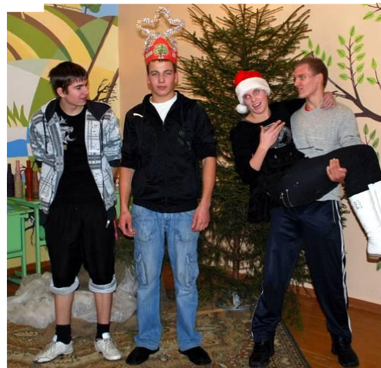
Trileris: „Su galiūnais panoro nusifotografuoti merginos. Vieną iš jų mokytojas kaip prizą dovanoja čempionui, tačiau jį aplenkia antros vietos laimėtojas ir prizą pasiima sau ...