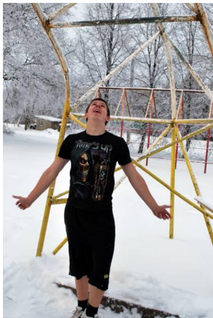
Aidas: „Padėk Dieve kuo daugiau kartų prisitraukti!...”