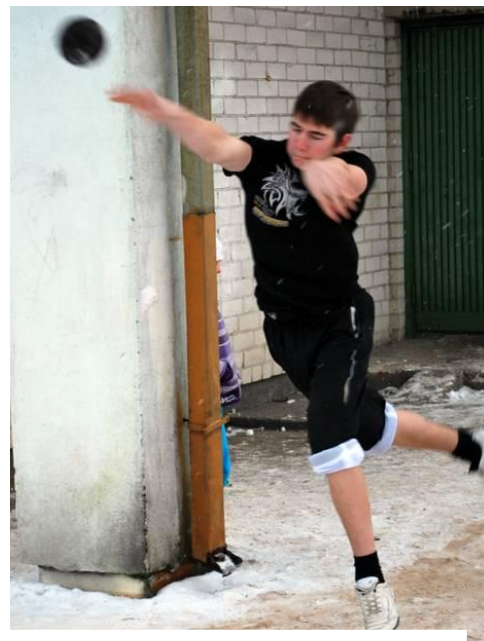
Žygimantas rutulį stumti moka ir dviem rankom!