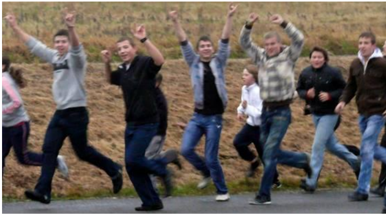
Vaikinai Širvintose tikrai „nepasišukšlino“...